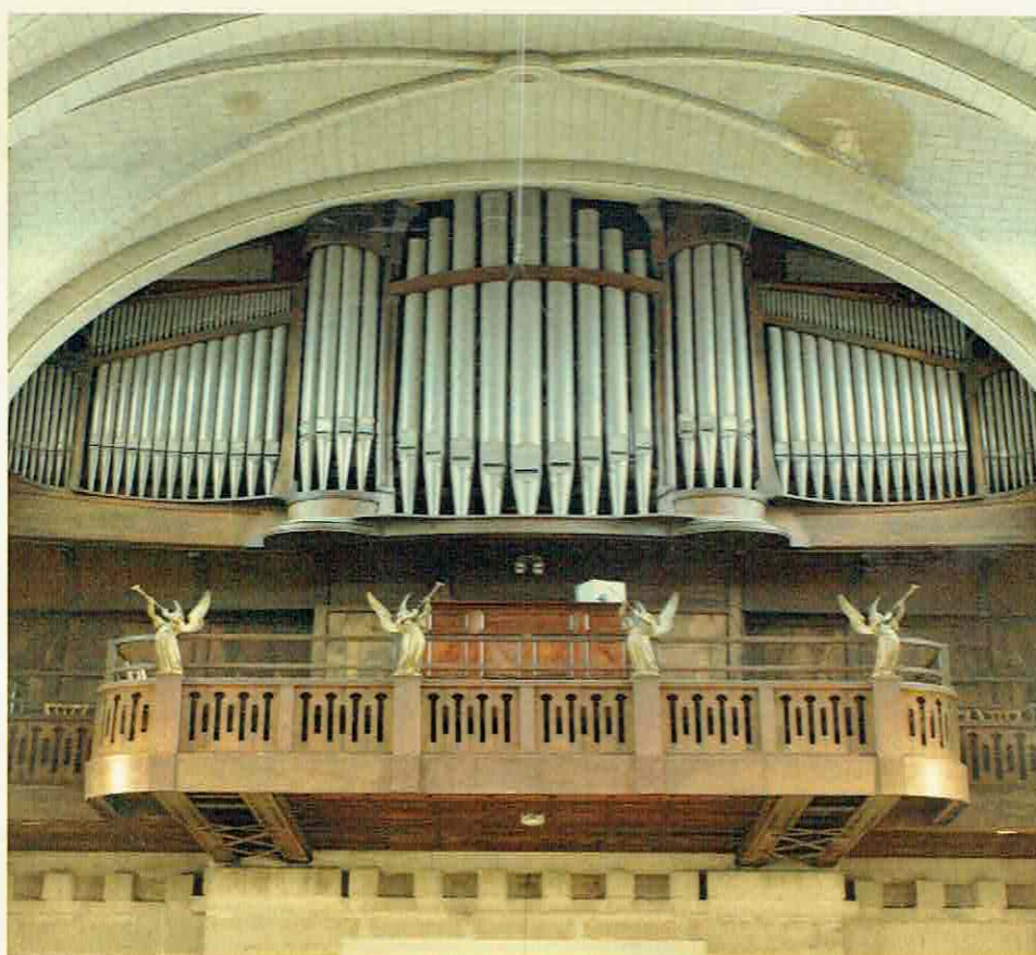
En 2009 à l'église Saint Vincent de Paul